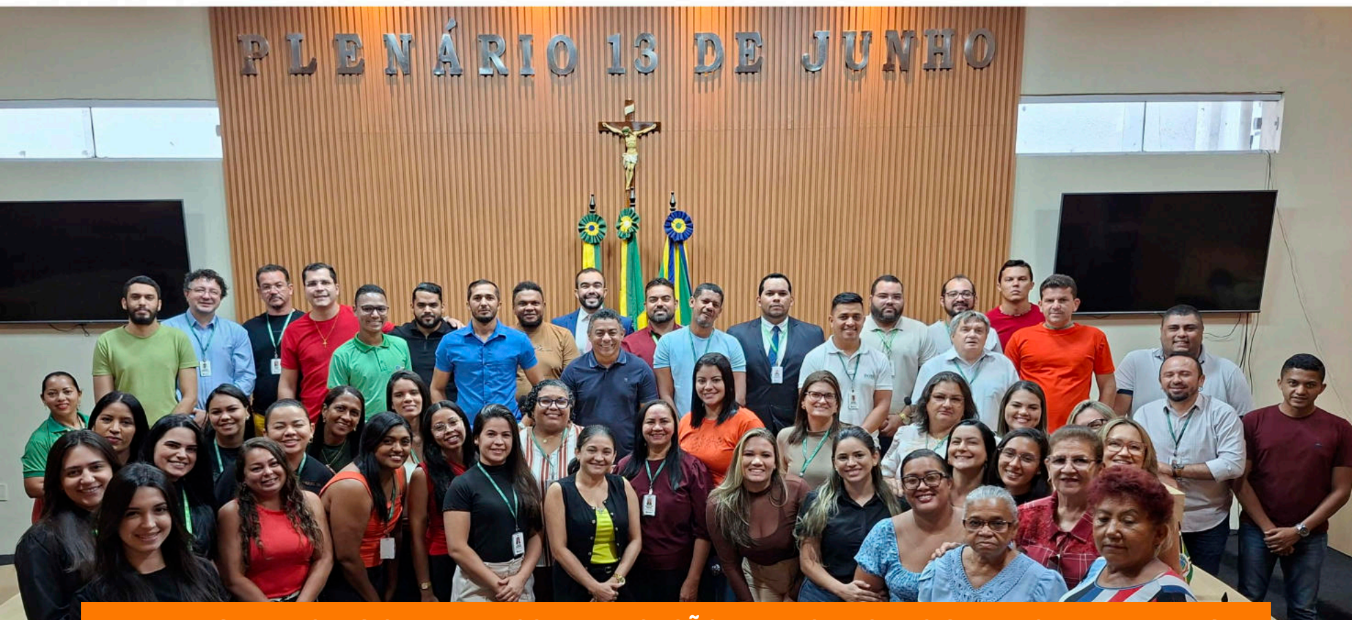
TIME DE SERVIDORES QUE ATUA COM DEDICAÇÃO EM PROL DO LEGISLATIVO BARBALHENSE!

O trabalho realizado fortalece nossa missão de servir com excelência, responsabilidade e cuidado com o bem público.